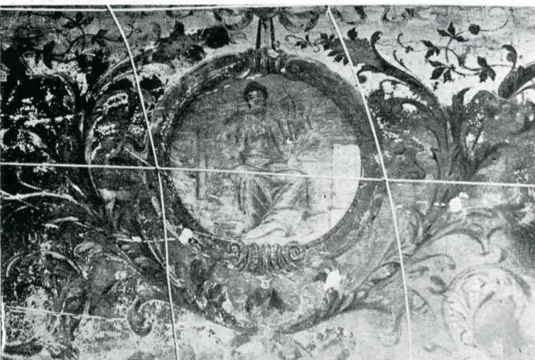
4—8 Fragmente de pictură decorativă de pe fațada clădirii din str. Occidentului nr. 11 B.