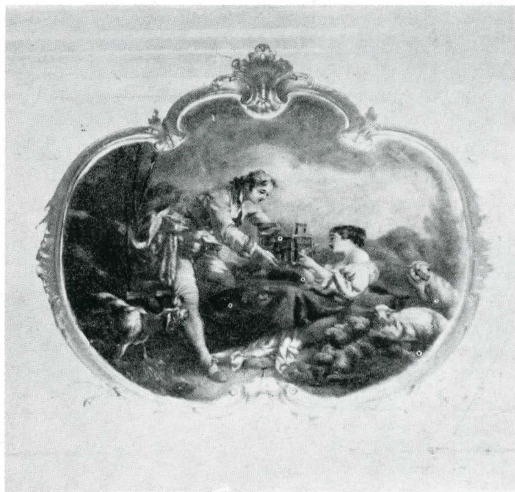
1—3 Pictură decorativă din locuința de pe Calea Victoriei nr. 194